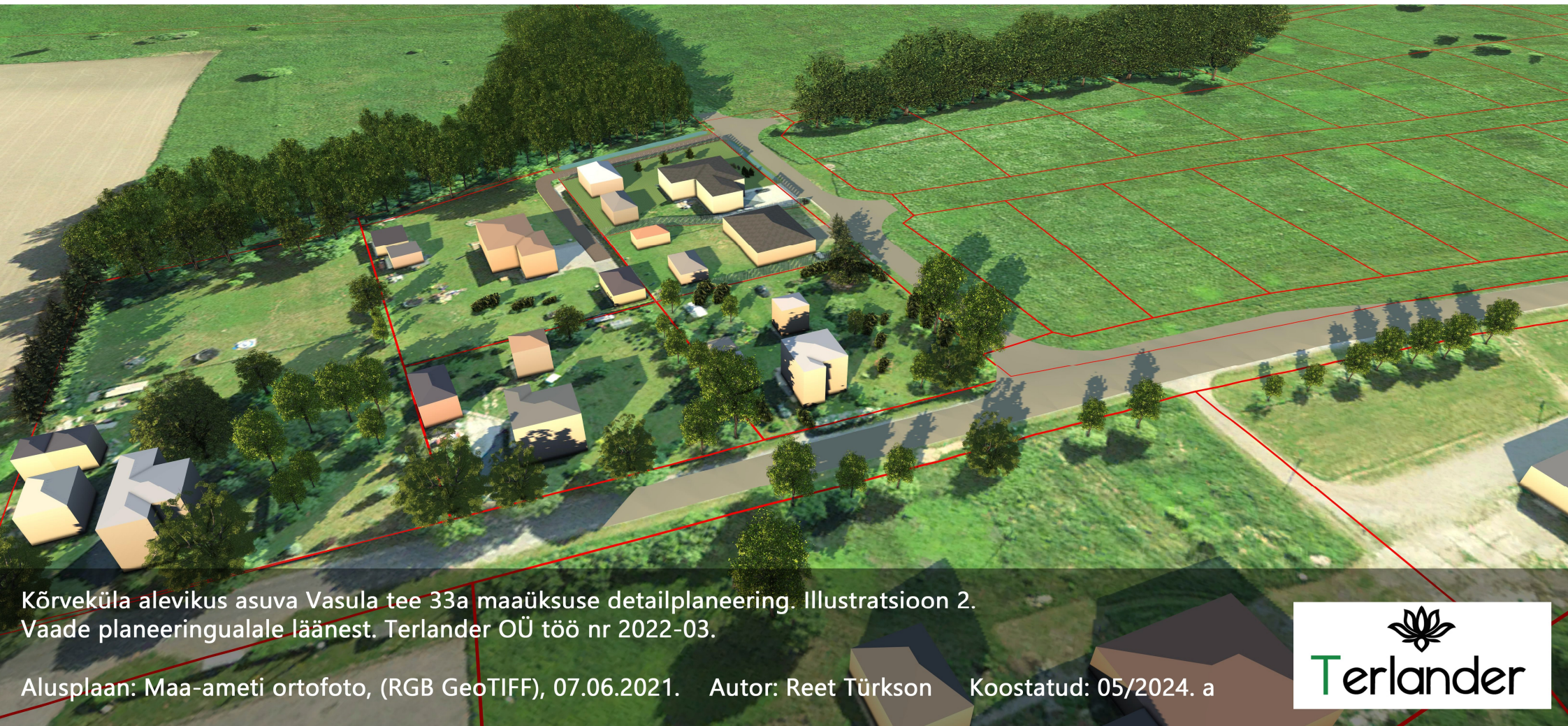
Kõrveküla alevikus asuva Vasula tee 33a maaüksuse detailplaneering. Illustratsioon 2. Vaade planeeringualale läänest. Terlander OÜ töö nr 2022-03.

Alusplaan: Maa-ameti ortofoto, (RGB GeoTIFF), 07.06.2021. Autor: Reet Türkson Koostatud: 05/2024. a