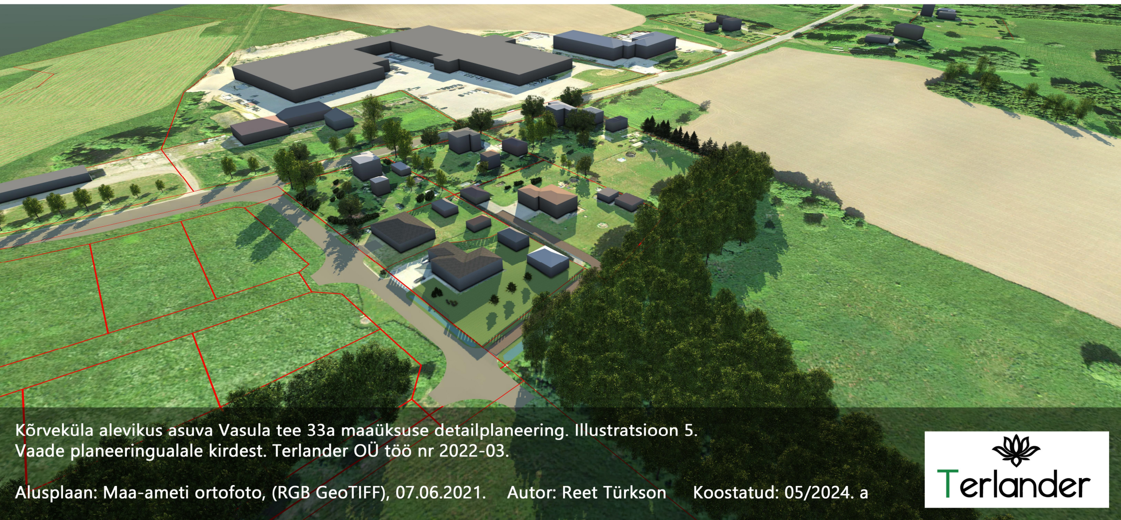
Kõrveküla alevikus asuva Vasula tee 33a maaüksuse detailplaneering. Illustratsioon 5. Vaade planeeringualale kirdest. Terlander OÜ töö nr 2022-03.

Alusplaan: Maa-ameti ortofoto, (RGB GeoTIFF), 07.06.2021. Autor: Reet Türkson Koostatud: 05/2024. a